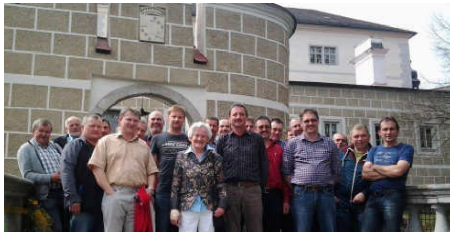
Die Klärwärter des Bezirkes Freistadt vor unserem schönen Schloß Weinberg.