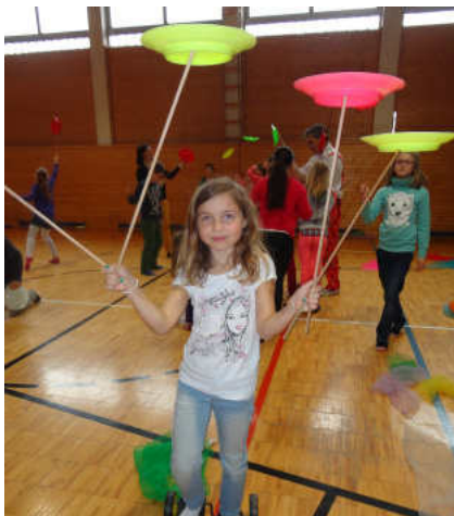
Einen Vormittag lang jonglieren

Unter diesem Motto begeisterte ein Jongleur die Schülerinnen und Schüler für's Jonglieren. Da flogen dann nicht nur Tücher, Teller und Diabolos durch die Luft, manche Kinder entpuppten sich als echte Talente und erlernten in kürzester Zeit kleine Kunststücke. Vor