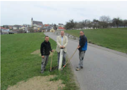
Wieder freie Sicht in Lehen!

Die an der Selkerer Gemeindestraße (Lehen) gelegenen Obstbäume konnten nun kurzfristig mit Zustimmung des Eigentümers durch unsere Bauhofmitarbeiter beseitigt werden. Somit gibt es diese unübersichtliche Stelle nicht mehr und es konnte dadurch ein wesentlicher Beitrag zur Verkehrssicherheit geleistet werden.