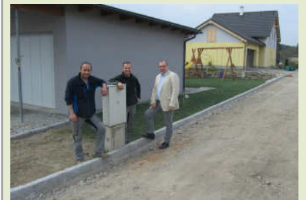
Randleisten an der Siedlungsstraße Albingdorf