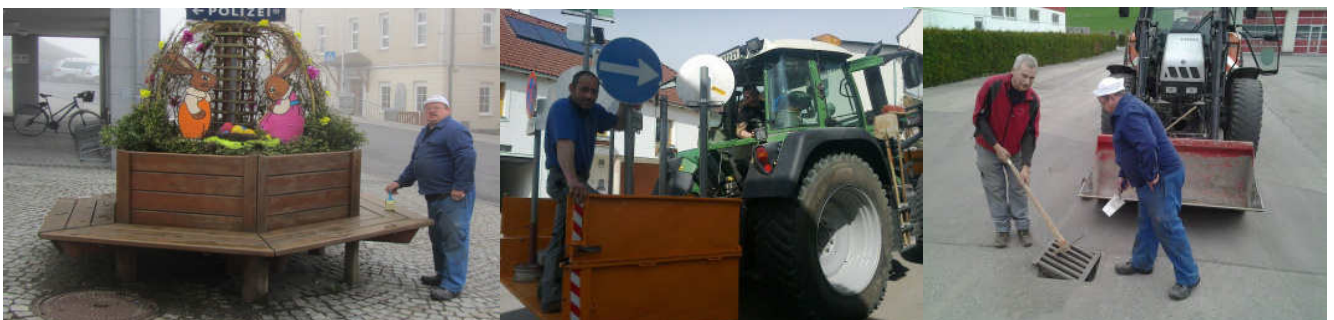
Unsere Bauhofmitarbeiter bemühen sich, unseren Ort und Gemeinde auf Schuß zu halten.

Lt. Veranstaltungssicherheitsgesetz wurden 10 Veranstaltungen bescheidmäßig bewilligt (zB. Ostermarkt und Weinberger Schloss Advent, Feuerwehrfest und Moto Cross Veranstaltung, Sportlerball, Konzerte und Kino) und 4 Bälle gemeldet.