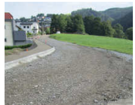
Straßenbaustelle Lehen ...

Bedanken möchte ich mich für das Verständnis der damit verbundenen Straßensperren und Umleitungen, sowie bei den Bauhofmitarbeitern, die sich sehr bemühen, die Bauzeiten äußerst kurz zu halten.