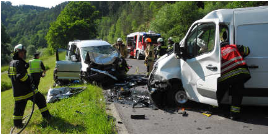
Verkehrsunfall mit verletzten Personen zwischen Kefermarkt und Gutau.