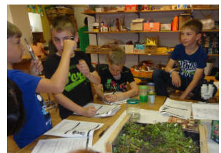
Den Boden erforschen die 3. und 4. Klasse