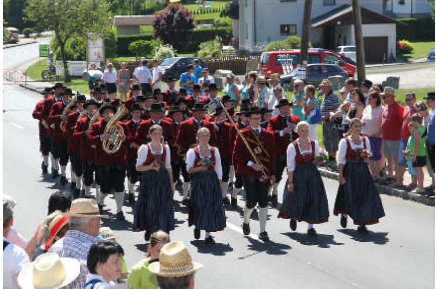
Ein ausgezeichnetes Ergebnis für die Musikkapelle bei der Marschwertung in St. Oswald.