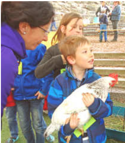
Sogar eine Henne gab es beim Frühlingsfest

Am letzten Tag im April feierten Kinder, Eltern und Lehrerinnen der Volksschule Kefermarkt den Frühling. Im Rahmen des Schulschwerpunktes „Förderung des kreativen Potentials“ gestaltete das Lehrerinnenteam unter Mithilfe vieler fleißiger Eltern für die Kinder einen abwechslungsreichen, vielfältigen und handlungsorientierten Vormittag, an dem die Kinder an verschiedenen Stationen zum Thema „Frühling“ ihre Kreativität ausleben konnten. Als besondere „Highlights“ stellten sich eine Farbschleuder mit Radantrieb, die Kochstationen, der Blumen- und Gräserdruck auf Stofftaschen und ein Streichelzoo mit Kaninchen und zahmer Henne heraus. Aber auch knifflige Frühlingsrätsel, Malen und Bewegen zu Musik und Mandalas aus Naturmaterialien konnten die großen und kleinen Kinder zu tollen kreativen Einfällen verleiten.