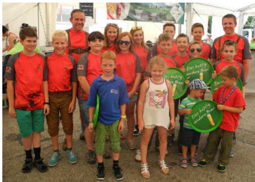
Bereits die Feuerwehrjugend hilft fleißig beim alljährlichen Fest.

Zum Abschluss der Saison findet der Feuerwehrlandesbewerb statt, dieses Mal in Hirschbach vom 10. bis 11. Juli. Hier können unsere Floris noch einmal richtig Gas geben! Ein Dankeschön gilt der Feuerwehrjugend für die tatkräftige Mithilfe beim Feuerwehrfest! Die Mannschaft und auch die Festbesucher freuen sich jedes Jahr über den Fleiß unserer jungen Mädchen und Burschen.