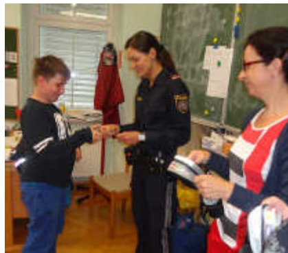
Herzlichen Glückwunsch zur bestandenen Radfahrprüfung