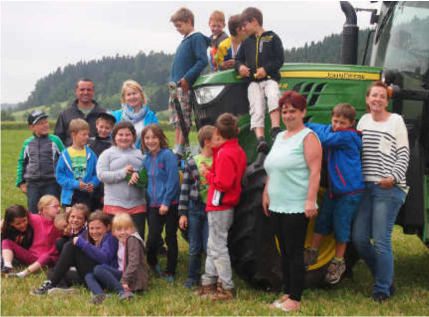
Ein Besuch am Bauernhof war ein interessanter Vormittag für die Kinder der 2. Klasse.