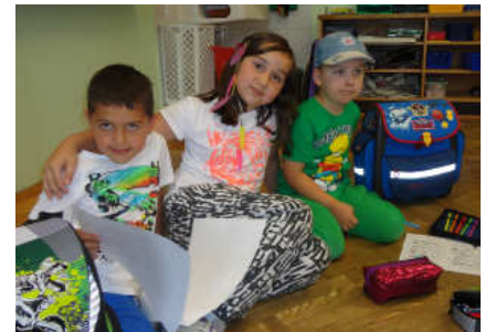
Die Schüler der 3. Klasse kümmern sich um ihre Schulanfänger-Patenkinder

In bewährter Form kümmern sich Patenkinder um die kommenden Schulanfänger. Damit diesen die Umstellung auf die Schule leichter fällt, können sie bei Besuchen in der Volksschule bereits vieles kennen lernen und ausprobieren. Patenkinder aus der 3. Klasse helfen und unterstützen sie dabei beim Turnen, Rechnen, Vorlesen, bei Lernspielen und beim Zurechtfinden im neuen Gebäude.