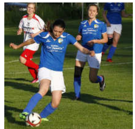
Die Damen haben sich den 1. Platz hochverdient!