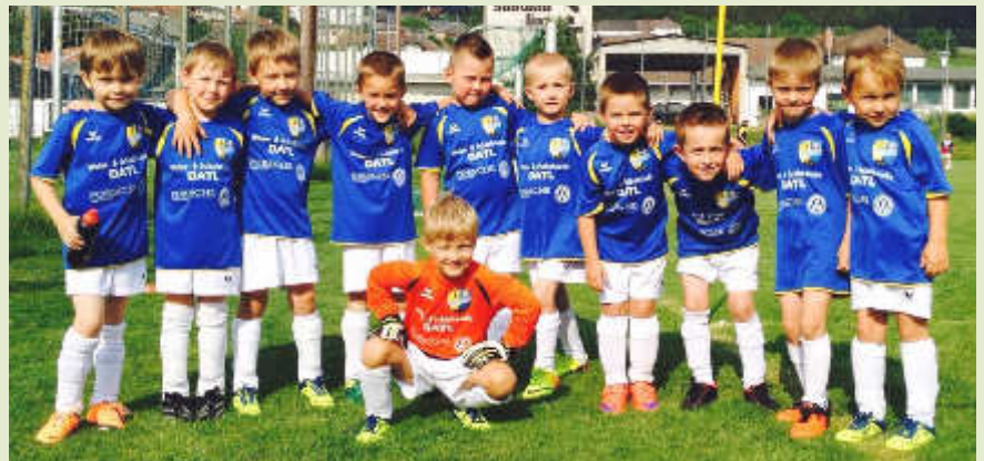
U6 - Die jüngste Mannschaft in der Vereinsgeschichte!

nen Knirpse sein. Das Wichtigste ist in dem Alter der Spaß am Sport, und das haben alle Spieler aus Kefermarkt und Neumarkt gehabt! Danke nochmal an die Gäste aus Neumarkt für das tolle Spiel! Ebenso einsatzfreudig waren im Frühjahr die Kicker der unter 7-jährigen. Bei zahlreichen Turnieren haben die kleinen Nachwuchskicker tolle Leistungen gezeigt. Ab Ende Juli haben die Nachwuchskicker eine kleine Pause verdient. Im August wird das Training wieder starten und es werden wieder viele Kinder am Fußballplatz umhertummeln.