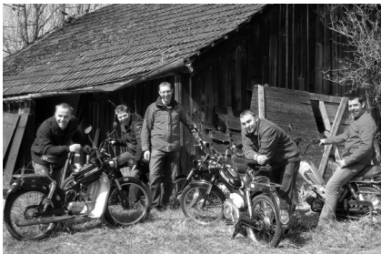
Die Organisatoren der Puch-Runde mit ihren Gefährten

Wie bereits in der letzten Ausgabe der Kefermarkter Gemeindepresse bekanntgegeben wurde, haben sich einige Kefermarkter zusammengeschlossen, um gemeinsam eine Ausfahrt mit Puch-Mopeds bzw. Motorrädern zu unternehmen. Der Termin hierfür ist der 16. Mai 2010. Treffpunkt um 13:30 Uhr beim Cafe Krah, von wo aus eine gemütliche, ca. 2 Stunden dauernde Fahrt geplant ist. Die Route führt von Kefermarkt in Richtung Elz, Paben, Lasberg, Freistadt und dann wieder zurück nach Kefermarkt. Auf der Strecke ist eine kurze Verschnaufpause inklusive Labstation für Fahrer und Gerät geplant.