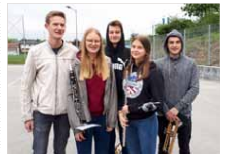
Die jungen Talente des Musikvereins Kefermarkt bei der Marschprobe

Ende April nahmen unsere MusiKefer an der alljährlichen Jungmusikermarschprobe des Bezirkes Freistadt teil. Trotz schlechtem Wetter marschierten dieses Jahr knapp 200 Jungmusikerinnen und Jungmusiker aus dem gesamten Bezirk am Sportplatz in Pregarten. Zunächst wurden die jungen Musikerinnen und Musiker in vier Gruppen aufgeteilt und die Kunst des gemeinsamen Marschierens erlernt – vom Instrumente aufnehmen bis hin zur großen Wende. Abschließend stellten die jungen Leute ihre neu erlernten Kenntnisse bei einem großen gemeinsamen Marsch über den Pregartner Sportplatz unter Beweis.