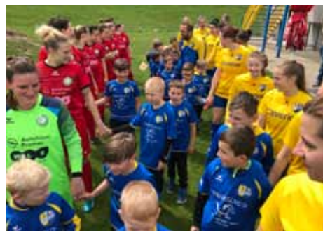
Einlaufen der Nachwuchskicker beim Damen-Heimspiel