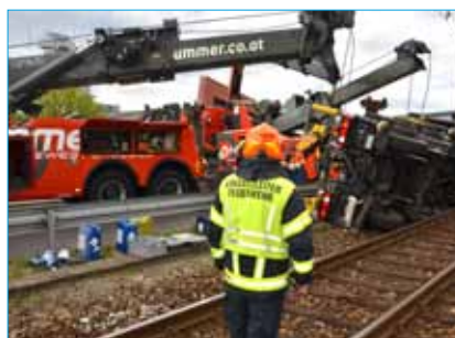
Schienenhubsteiger bei Arbeiten an der Oberleitung umgestürzt

Zu einem Verkehrsunfall mit eingeklemmter Person wurden Sonntagmittag, 28.04.2019 drei Feuerwehren nach Kefermarkt alarmiert. Ein Schienenfahrzeug stürzte bei Arbeiten an der Oberleitung um und krachte mit dem Arbeitskorb auf die Lasberger Straße zwischen den beiden Bahnübergängen. Ein Arbeiter, der sich im Arbeitskorb befand, wurde beim Umstürzen des Arbeitsfahrzeuges verletzt.