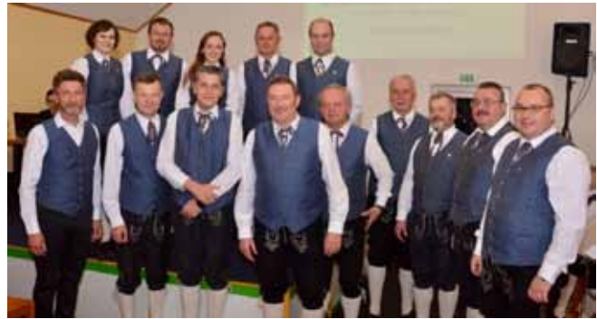
Zahlreiche Ehrungen bei der JHV für langjährige aktive Mitglieder des Musikvereins