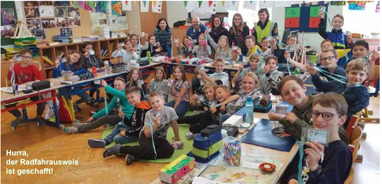
Hurra, der Radfahrausweis ist geschafft!