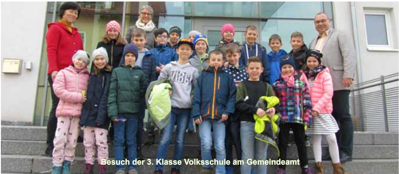
Besuch der 3. Klasse Volksschule am Gemeindeamt

der Aufgaben, die die Gemeinde zu erfüllen hat. Im Anschluss wurden die Kinder durch die Büroräume geführt und die einzelnen Abteilungen vorgestellt. Als Abschluss erhielt jedes Kind eine kleine süße Aufmerksamkeit vom Bürgermeister überreicht.