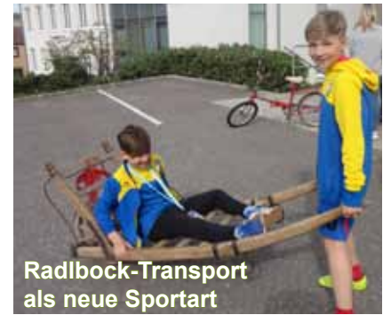
Radlbock-Transport als neue Sportart

altersgemischten Gruppen ging es bei sechs von Eltern betreuten Stationen um Ausdauer, Koordination, Kraftspiele und - auch ganz wichtig - Entspannung. Siegerdenken und Konkurrenz hatten kaum Platz, weder beim Zumba-Tanzen noch beim Wiesenlauf, Sackhüpfen und Rückenfit-Übungen.